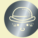
Presenting Partner / Platin Clown